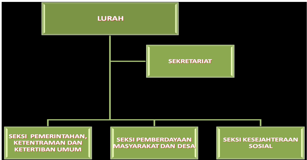
Gambar 2. Struktur Organisasi Kelurahan