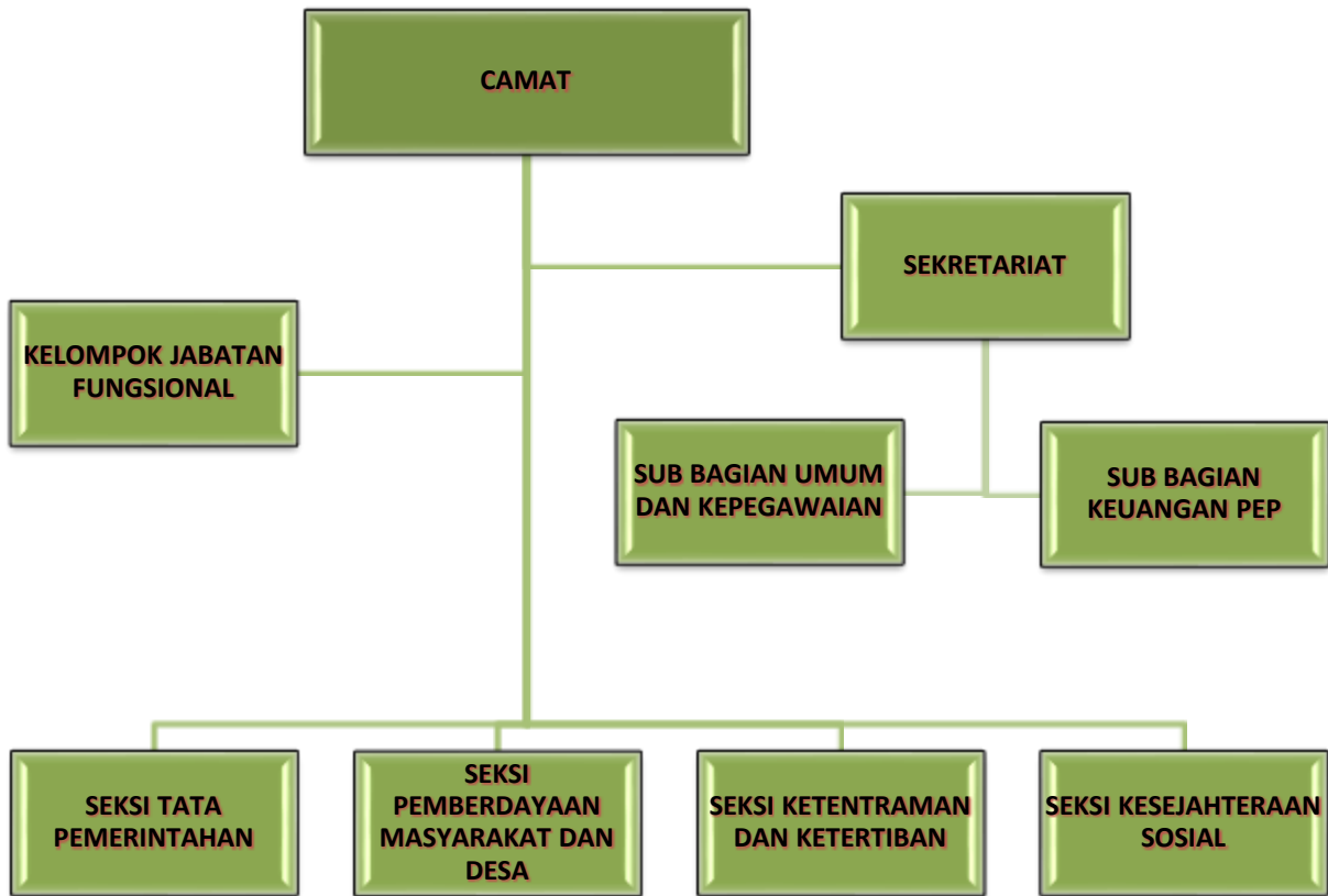
Gambar 1. Struktur Organisasi OPD Kecamatan

Adapun Struktur Organisasi OPD Kecamatan adalah sebagaimana dalam gambar sebagai berikut :